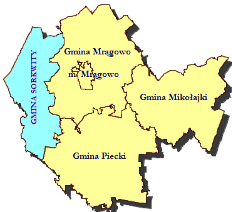
Rysunek 1. Gmina Sorkwity na tle powiatu mrągowskiego

Miejscowość, jak i gmina, posiada istotne walory przyrodniczo-rekreacyjne, które stwarzają podstawy do rozwoju szeroko pojętej turystyki, a także agroturystyki. Również kulturowo jest to teren bardzo ciekawy.